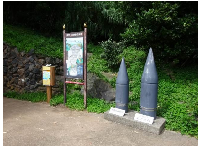
同左，弾丸の重さ 1t，射程 35km