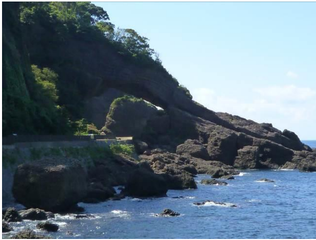
素堀トンネル（旧国道）