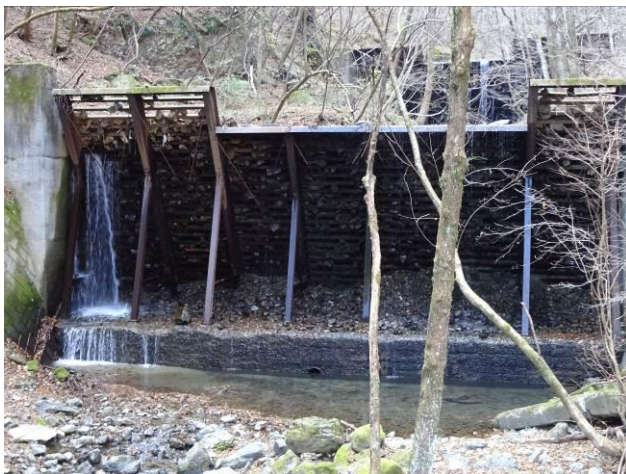
透過型ダム 目詰まりによる満砂状態→目標機能の失敗？