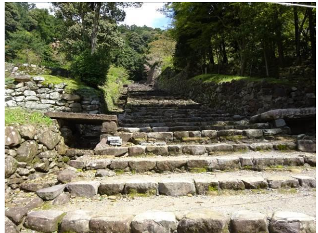
安土城天守への大手道 （所々石仏を使用・・・意図的？）