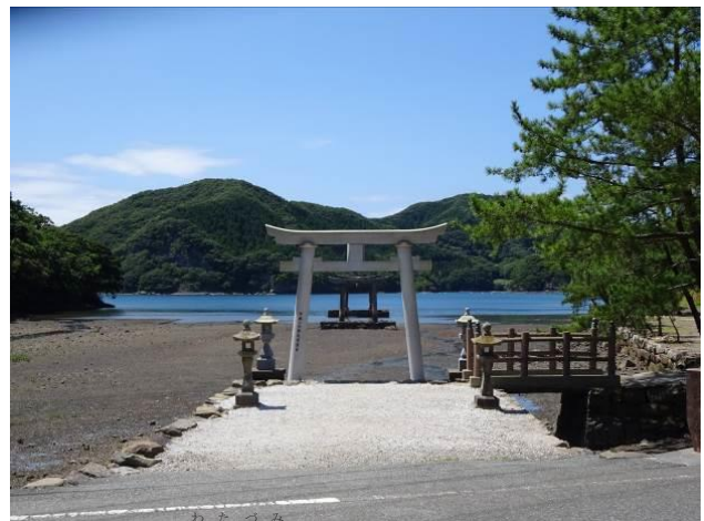
和多都美神社鳥居（対馬）