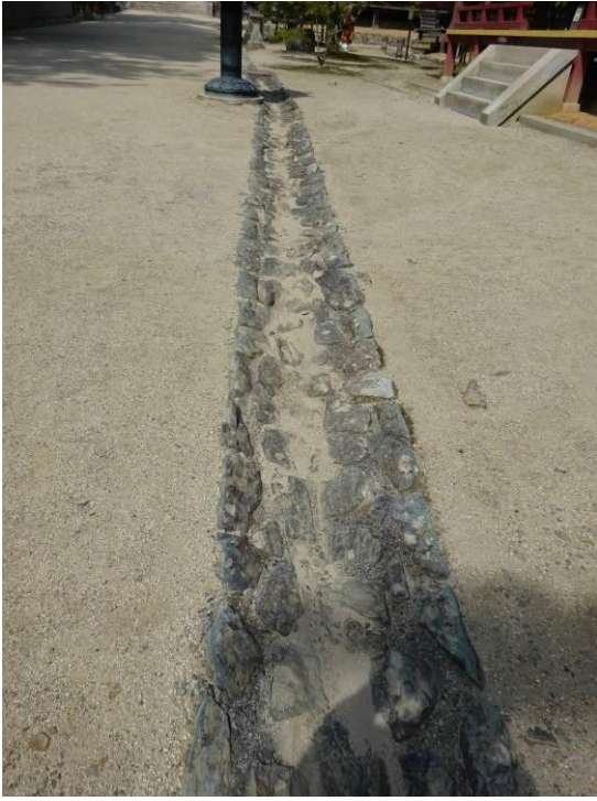
石張り水路（高野山）