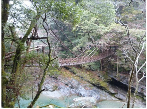
葛橋（徳島県：大歩危小歩危）