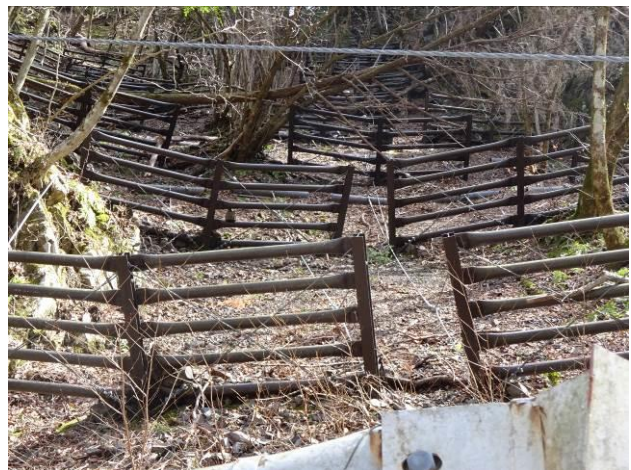
雪崩防護柵 (ワイヤーロープによる吊り下げ式)