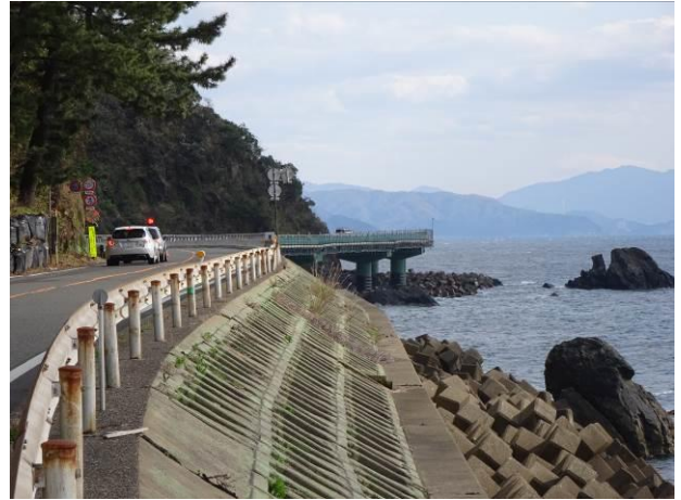
落石斜面の迂回（越前海岸）