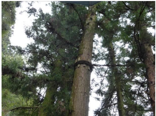
折れやすいスギにアンカー...