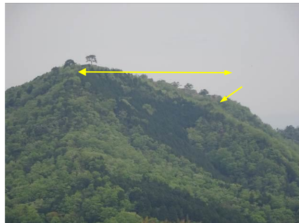
天空の城：竹田城（兵庫県朝来市）