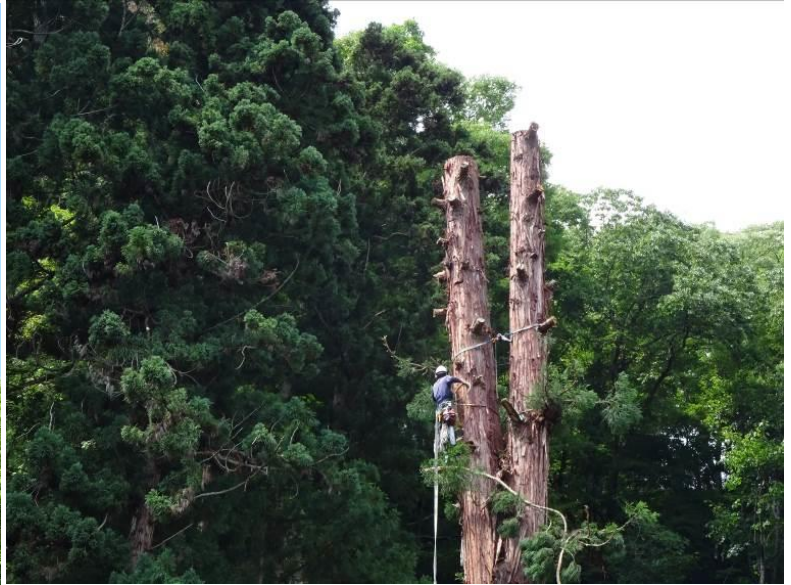
支障木（スギ）の伐採（長野県） 想像を絶する作業風景であった・・・