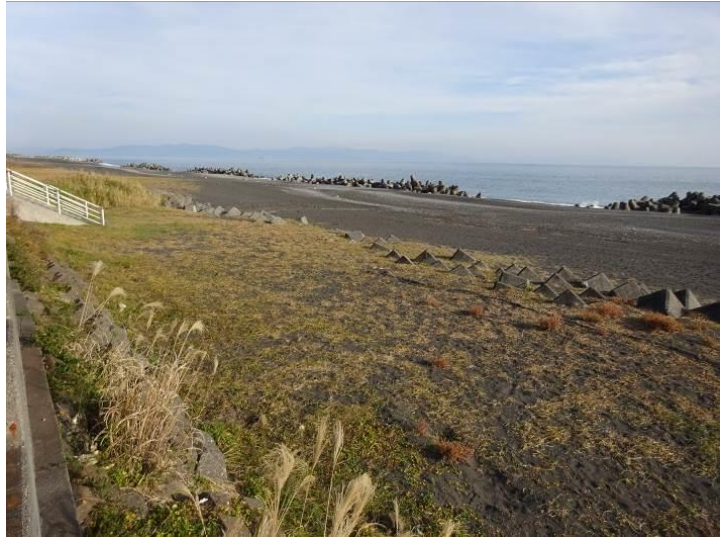
護岸（静岡県清水港付近）