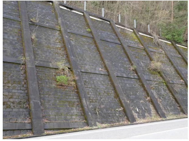
ブロック積み+現場打ち法枠