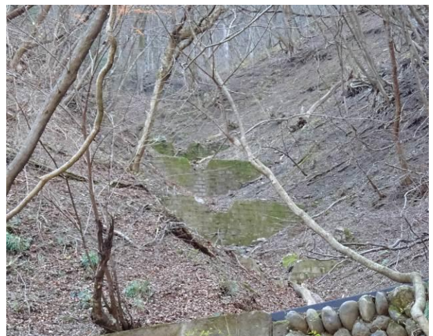
堰堤群（ブロック積み？）