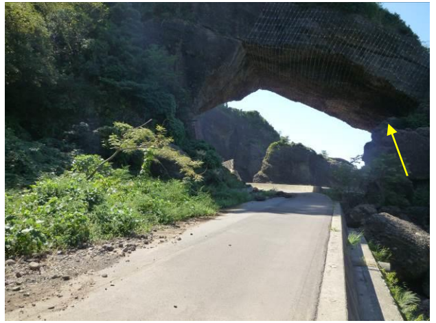
同左，ワイヤーネットによる補強（現在通行止）