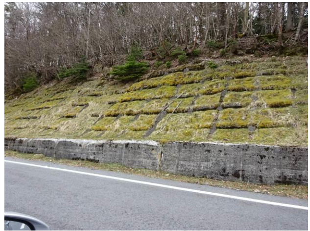
法枠+枠内の植生土嚢