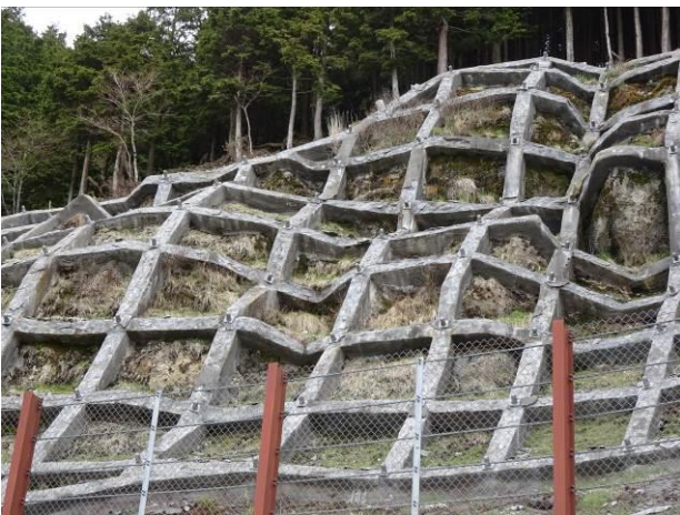
鉄筋挿入の必要性？