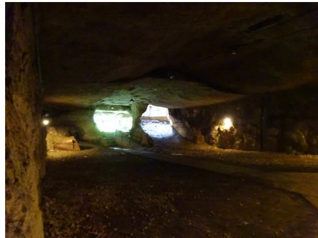
黒崎砲台跡内部 (奥の明るい場所に回転式の砲台を設置)