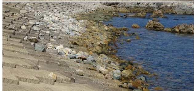
波力により運搬された岩塊（φ50cm程度，和歌山）