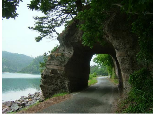
素堀トンネル（島根県隠岐の島、土木遺産）