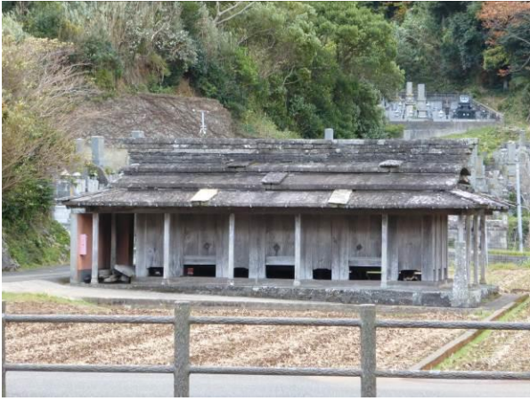
石屋根（頁岩）とこれを支える柱（長崎県対馬・倉庫）