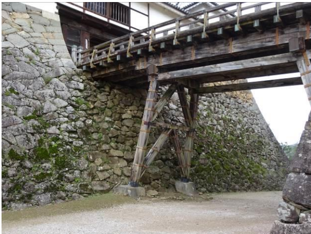
彦根城の廊下橋（滋賀県彦根市）