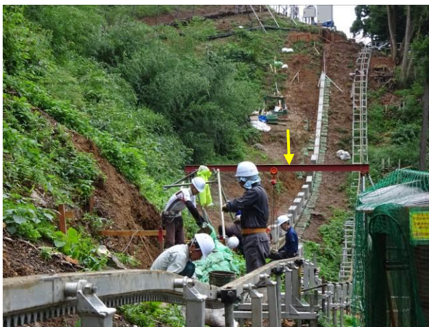
簡易レールクレーン（お見事！） （単管三脚支柱，チェーンブロック，H鋼）