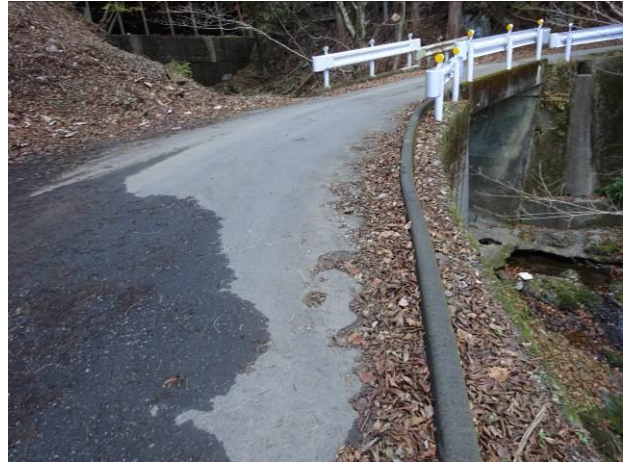
路肩の処理（周辺斜面への浸食防止，路面水による融雪）