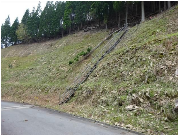
森林管理用仮設路