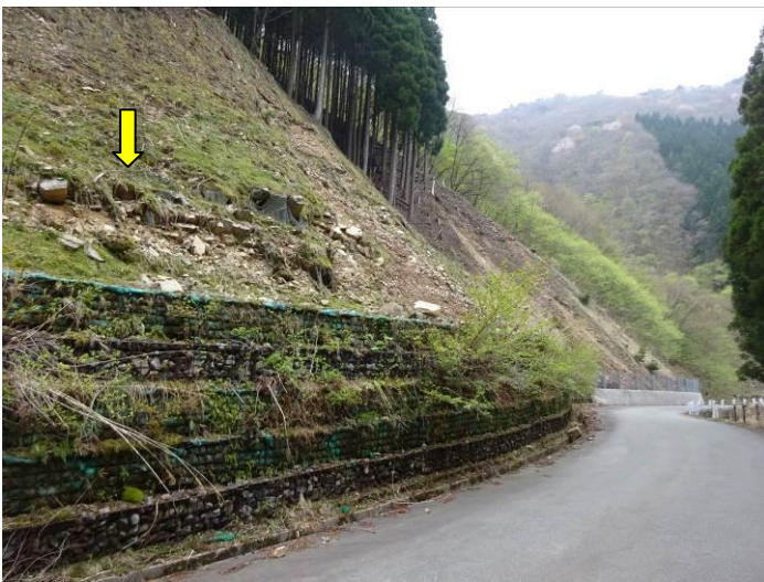
埋め戻し土（擁壁背面）の転圧不足による退行性浸食の助長