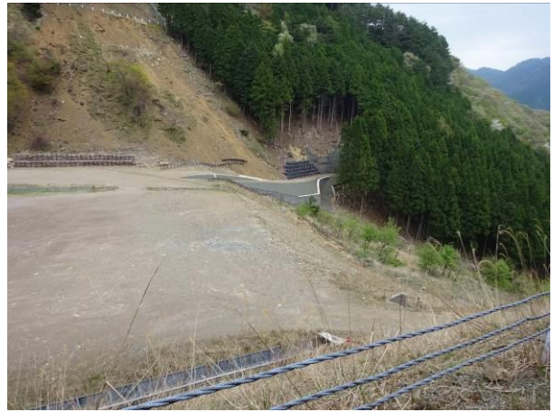
谷部への残土処理