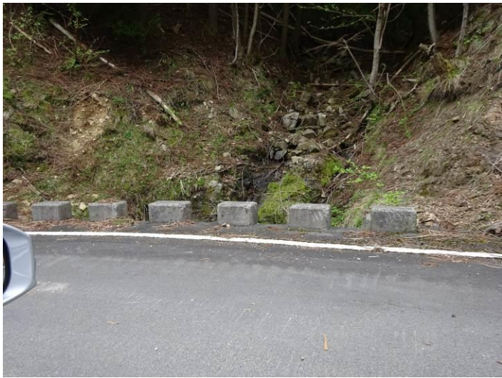
路肩を利用したスクリーン（お見事！）