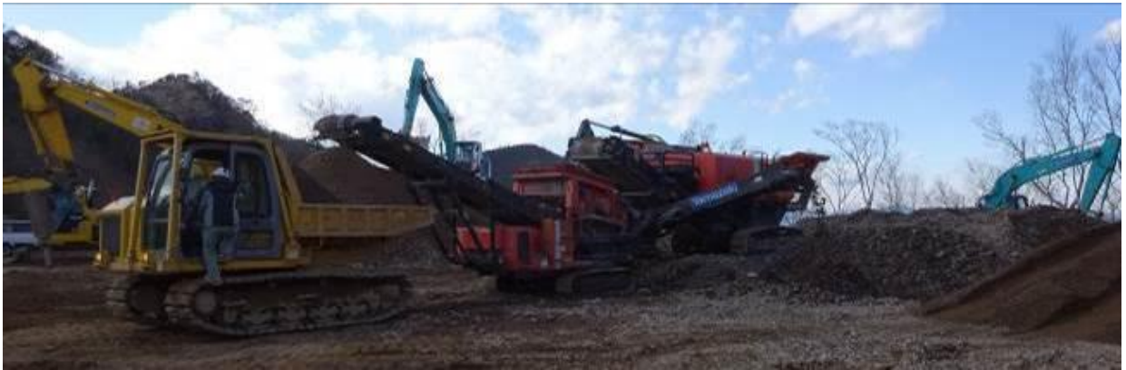
現地発生材の処理