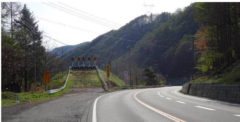
車止め（長野県） ・・・緊急避難路