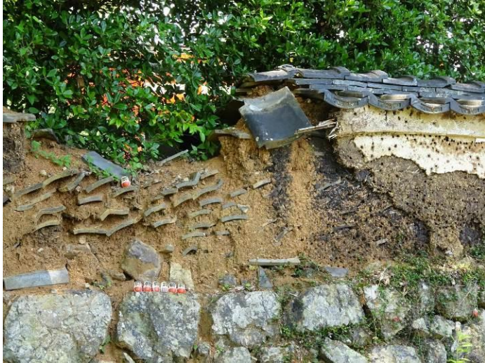
瓦を組み合わせた土塀（箕面市勝尾寺） …アイデア