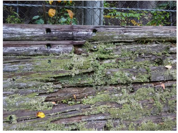
落石防護柵基礎擁壁の木製残置型枠