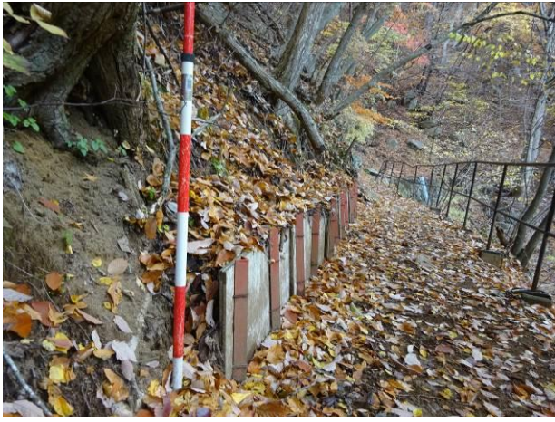
ボード（合板？）による簡易土留（甲府市）