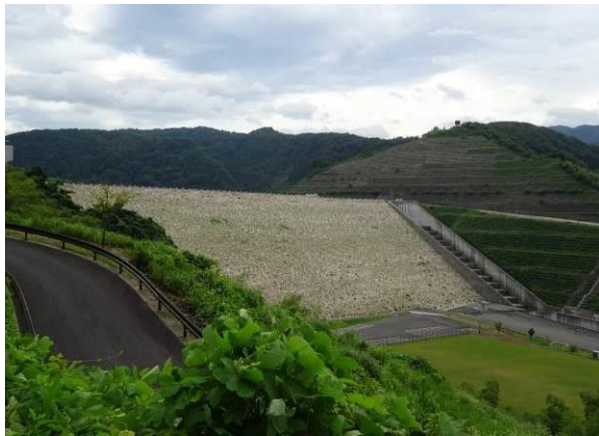
ロックフィルダム（水裏：鳥取市殿ダム）