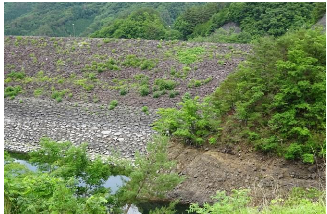
ロックフィルダム（水表：甲府市）