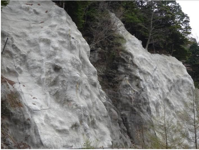
谷出口を利用した防護ネット