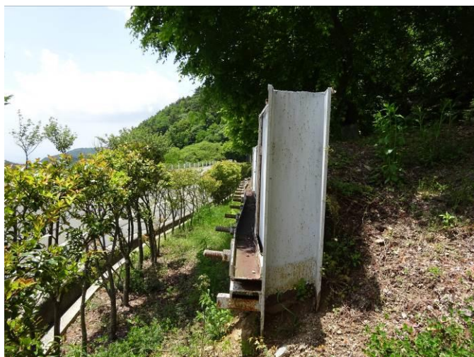
H鋼（杭）とアンカーによる防護柵