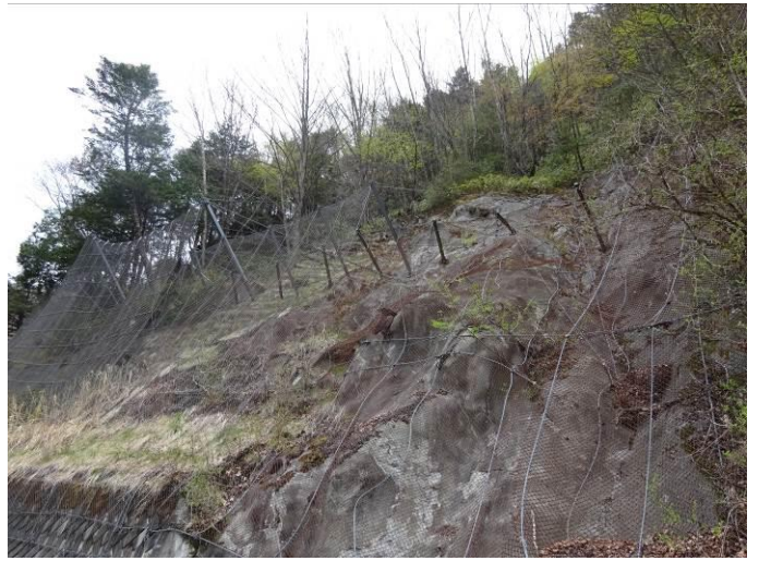
防護柵の支柱を徐々に高くする必要がある斜面