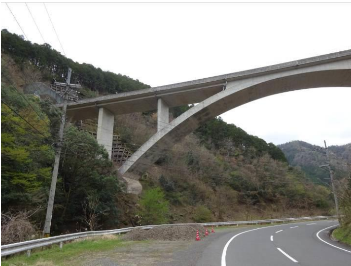
数十年前、型枠大工の担い手不足などから、曲線のコンクリート構造物ができなくなると聞いていたが・・・