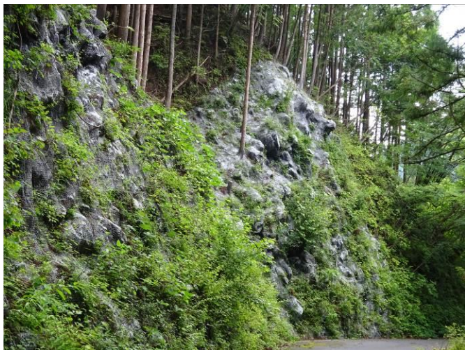
微地形に密着したネットによる固定状況