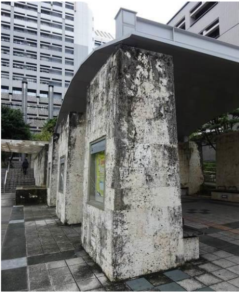
表面は石灰岩の化粧板