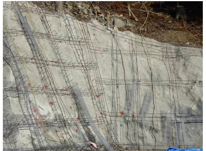
法枠背面の素吹き（谷出口付近，排水パイプなし→水圧？）