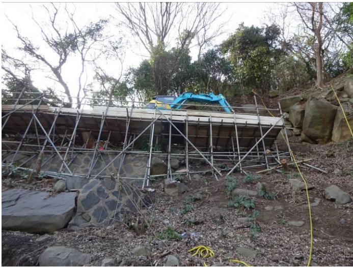
バックホウ（0.15m 3 ）用足場（・・・意外と簡易）