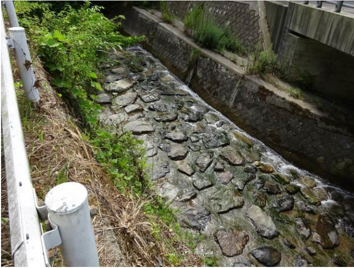
自然石を用いた底張