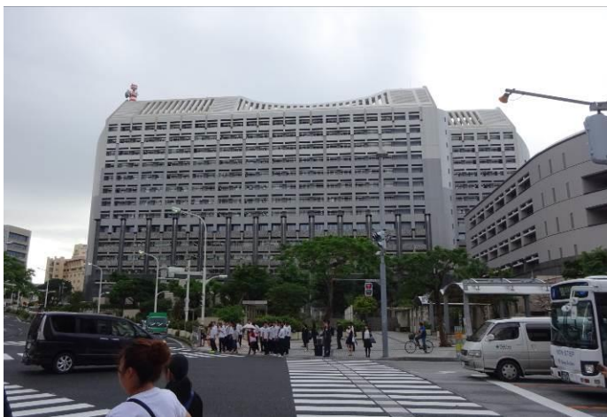
沖縄県庁（敷地が狭い）