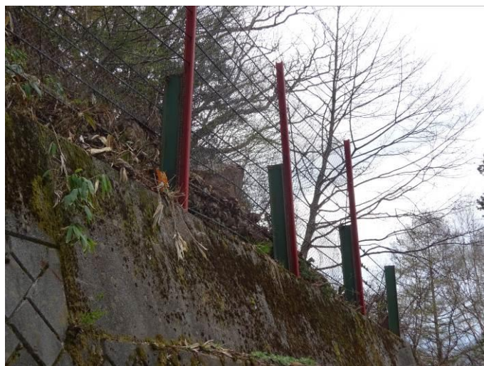
応急対策例（嵩上げ）

堆積することでステップ(緩斜面)が形成され、緩衝材として利用できる。したがって、堆積土砂を除去するのではなく、右写真のように支柱を継ぎ足すことが適当。