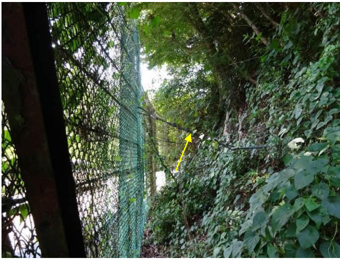
ストーンガードの控えアンカー