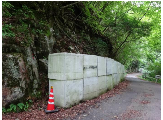
コンクリートブロックによる応急土留