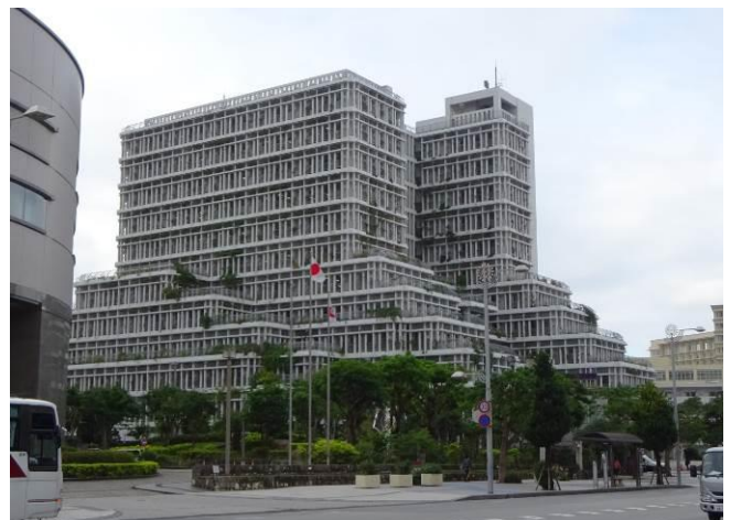
隣的那覇市役所（マッチ細工のような）