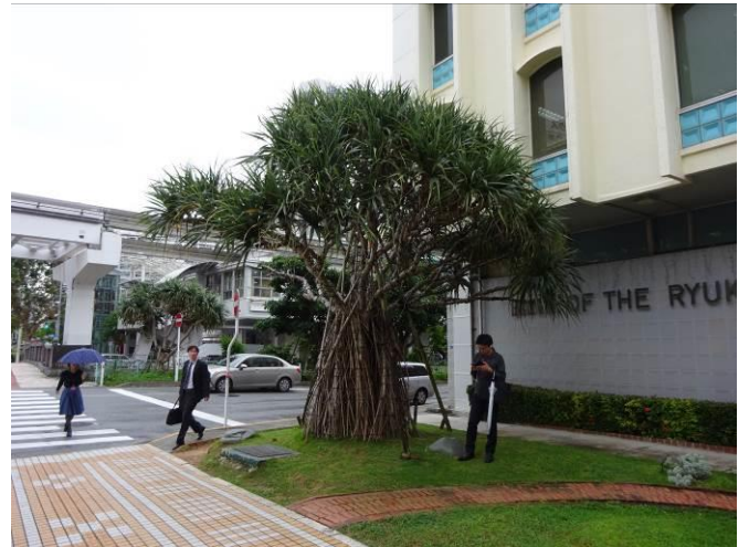
中国からの観光が多いような...