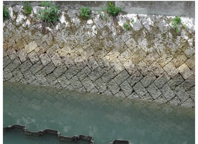
琉球石灰岩（サンゴを主体とする数万年前の堆積物）の護岸