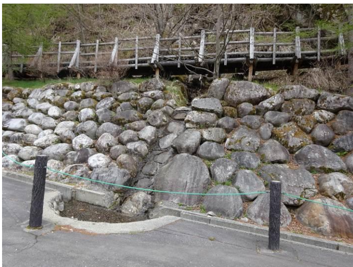
巨礫を用いた石張り