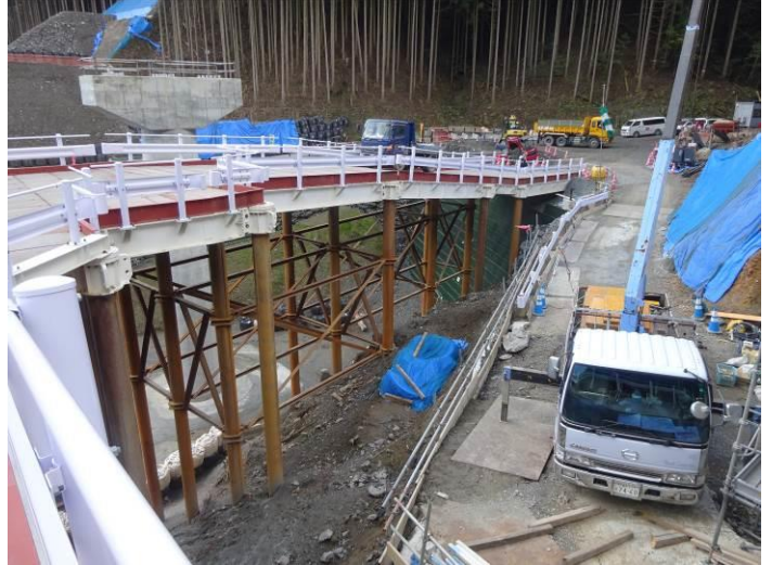
杭基礎による作業道