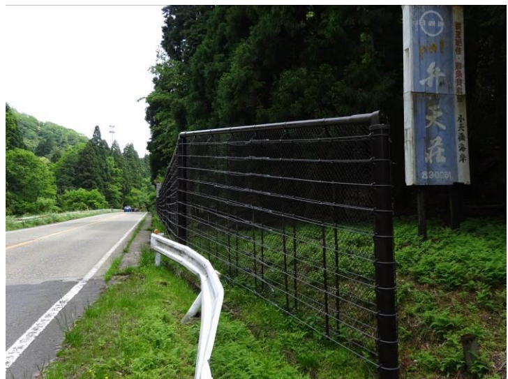
ロープを二重にした例