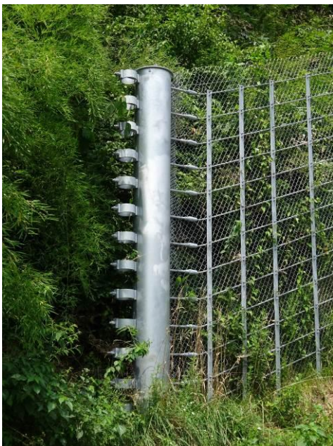
落石エネルギー吸収策 (支柱に取り付けたリングの変形を利用?)