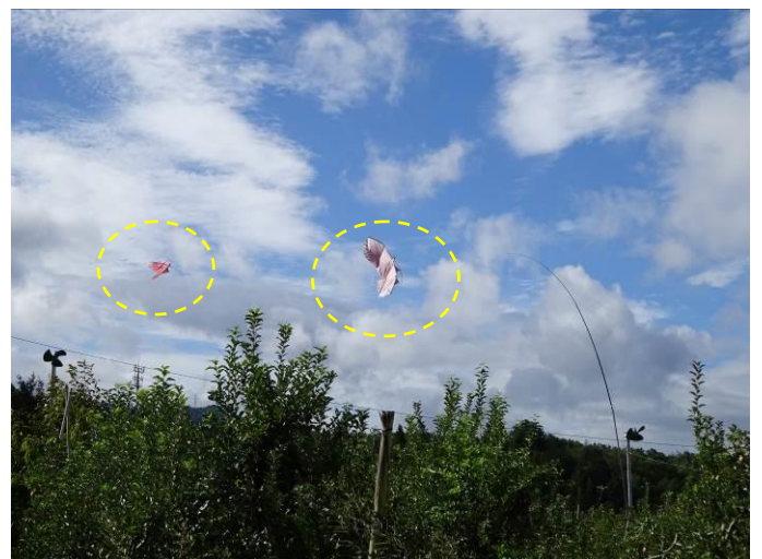
鳥避け“凧”：棹先の糸に釣られて泳ぐ (長野りんご園)