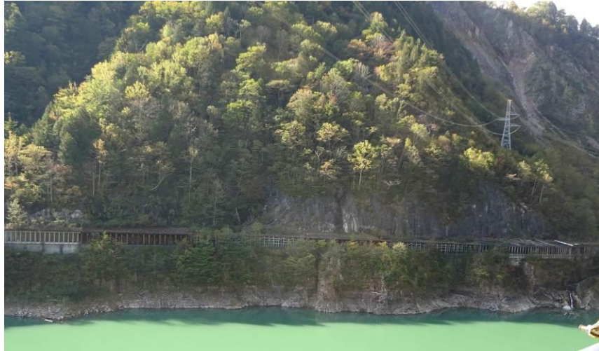
古いロックシェッド（屋根が平坦状）