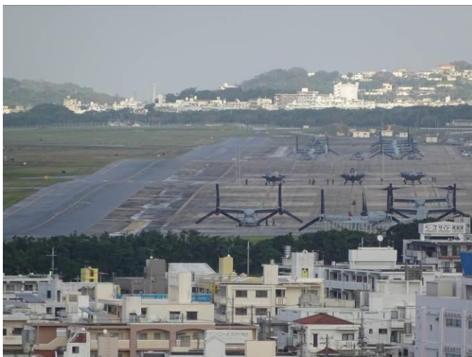
普天間飛行場とオスプレイ 整然とした米軍基地が面積的に多くを占有しており、 これらが消滅すれば殺風景となるような気もする...