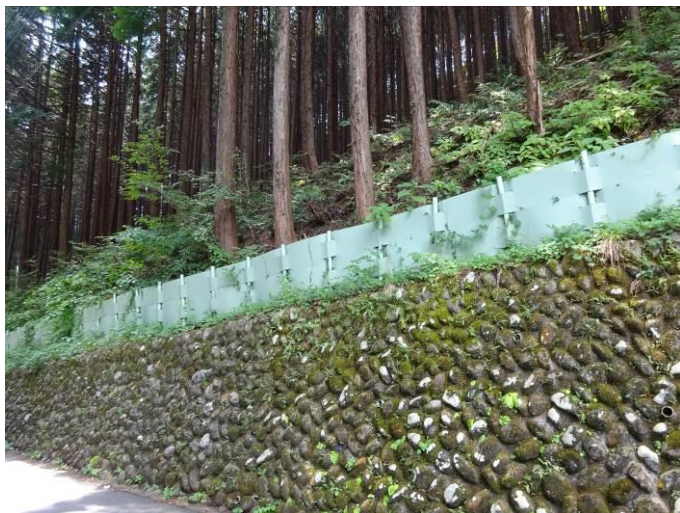
簡易な落石防護柵（奥多摩）