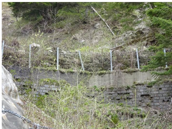
防護柵背面の堆積状況

堆積することでステップ(緩斜面)が形成され、緩衝材として利用できる。したがって、堆積土砂を除去するのではなく、右写真のように支柱を継ぎ足すことが適当。