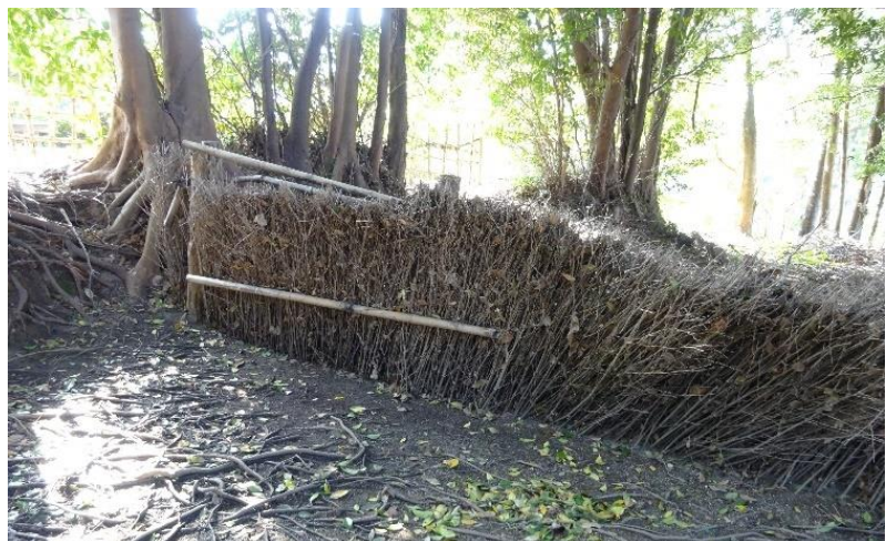
竹の枝を並べた垣根