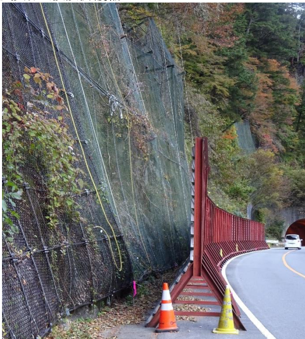
○移動式仮設防護柵