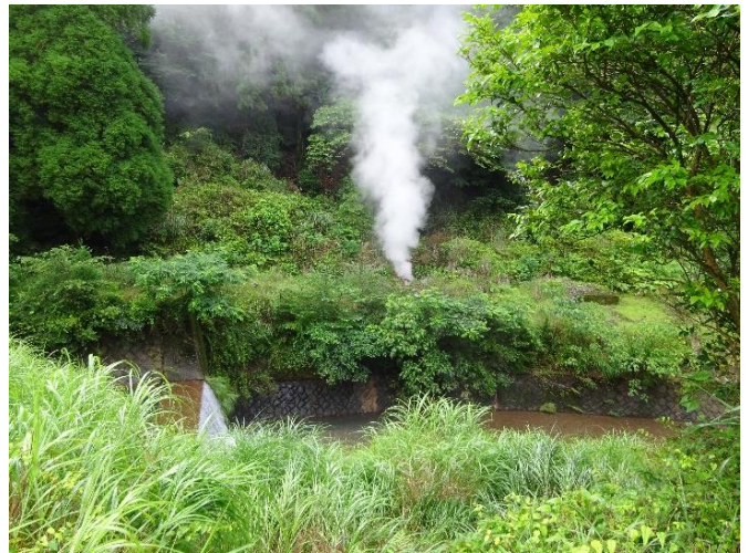
霧島地内の噴泉状況