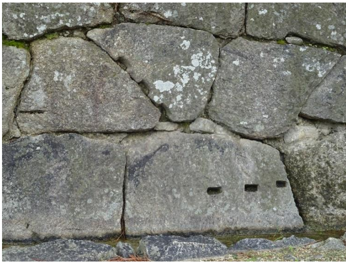
石を割るときの芹矢跡