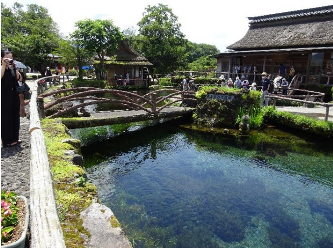
忍野八海（山梨県忍野村：富士山の伏流水）