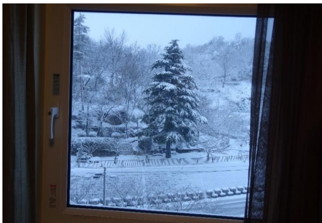
○滋賀県東近江市の冬