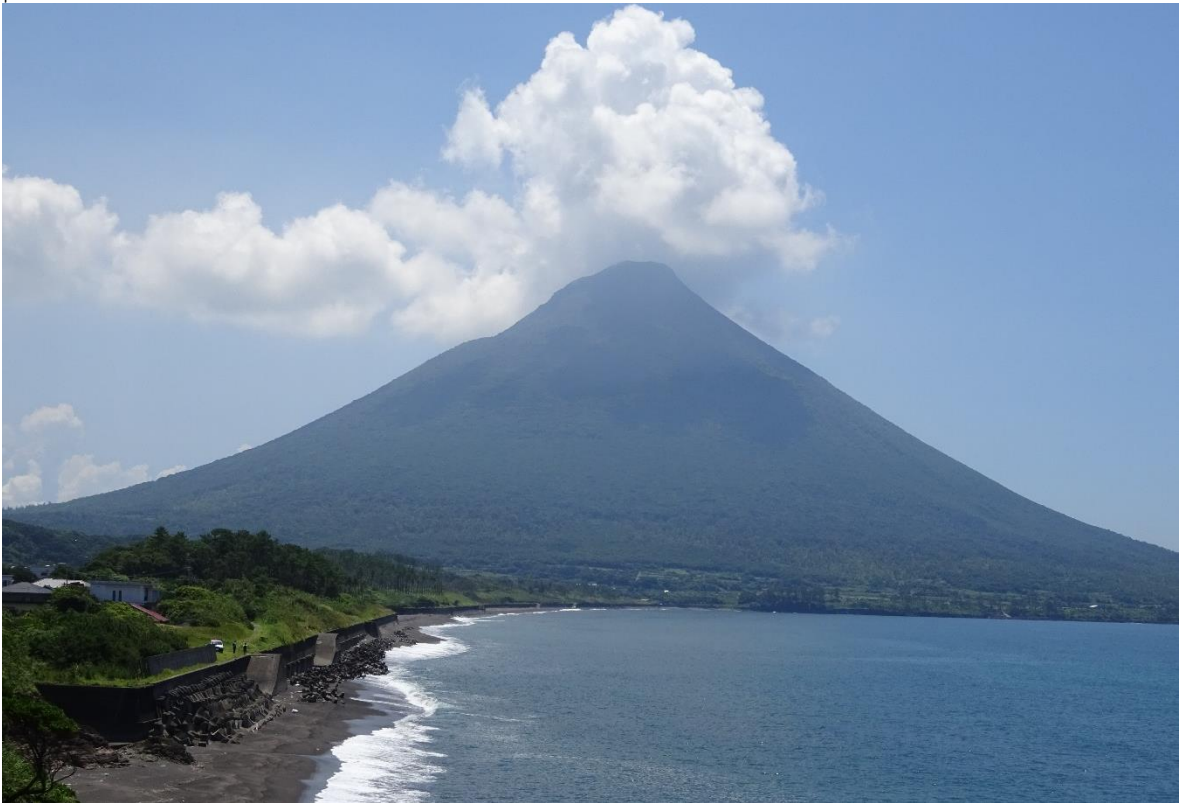
開聞岳（鹿児島県指宿：薩摩富士）. 山頂付近のくびれ（噴火口跡）から安山岩が噴出する二重式火山