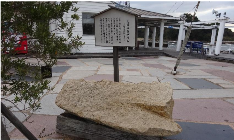
大阪城へ切り出した花崗岩：右芹矢跡（新岡山港）