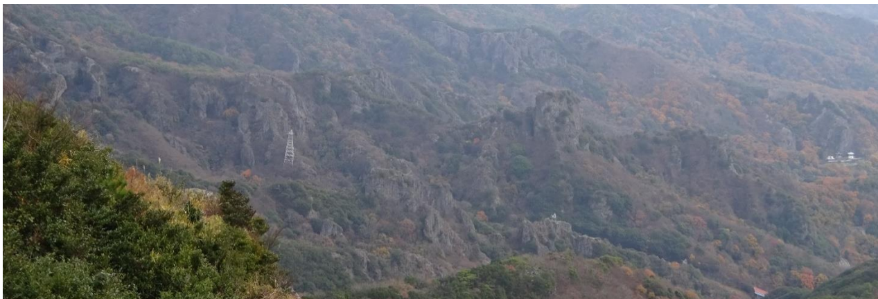
寒霞溪：火砕岩の奇岩群