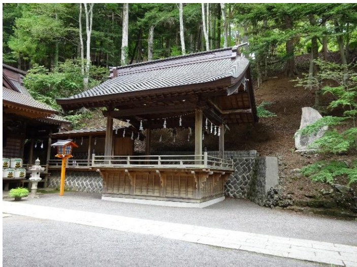
新倉山浅間神社舞殿

…基礎と建物との間に複数の鉄板（15cm 角程度、ステンレス？）をかませることで縁切り状態