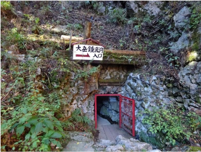
あきる野市大岳鍾乳洞（とても狭く、ヘルメット必須）