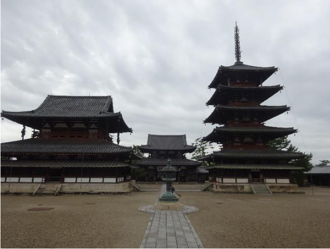
五重塔は平屋建てに分類・・・屋上屋を重ねた状態