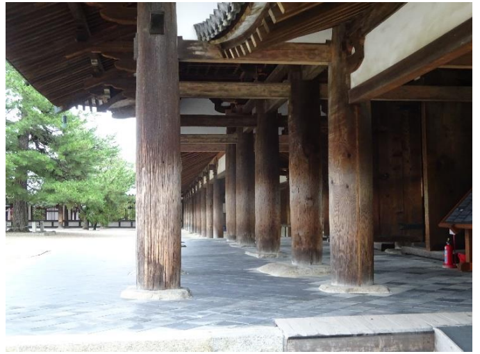
ギリシャ神殿のエンタシス（柱の中央が膨らむ） 様式に似ているが、関連は不明とのこと