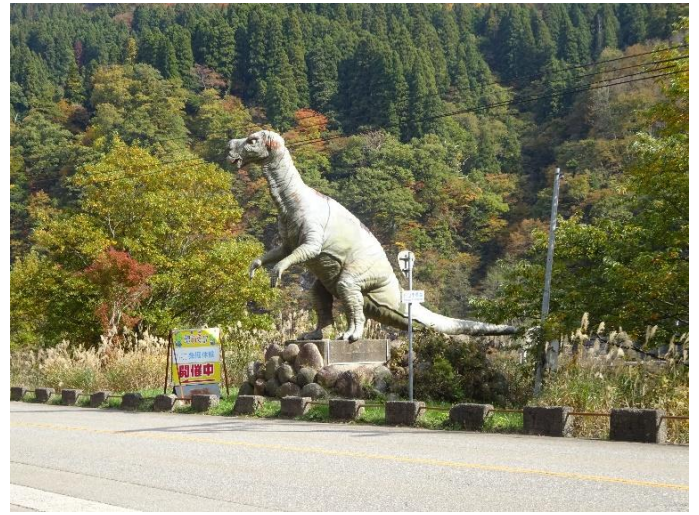
白山市 恐竜パーク入り口