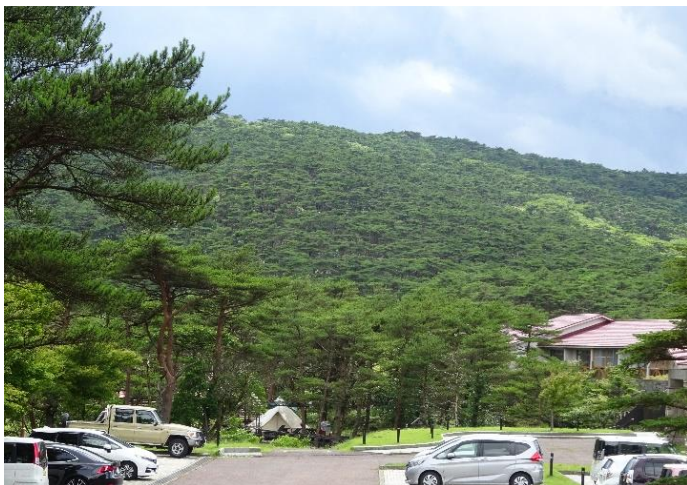
えびの高原：“原っぱ”をイメージしていたが、手 入れされたアカマツ林で覆われていた.