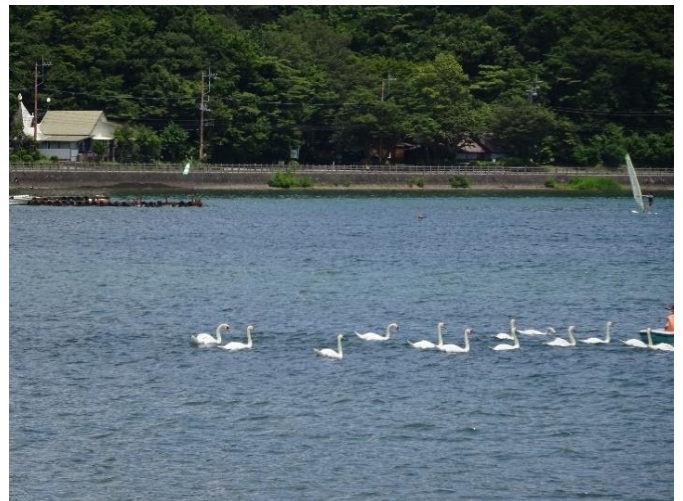
ボートに連なる・・・（山中湖）