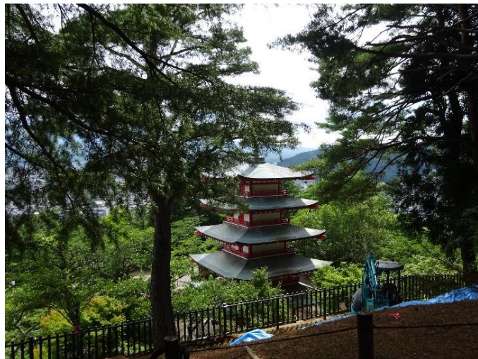
同左，富士山の撮影スポットは工事中…

…基礎と建物との間に複数の鉄板（15cm 角程度、ステンレス？）をかませることで縁切り状態