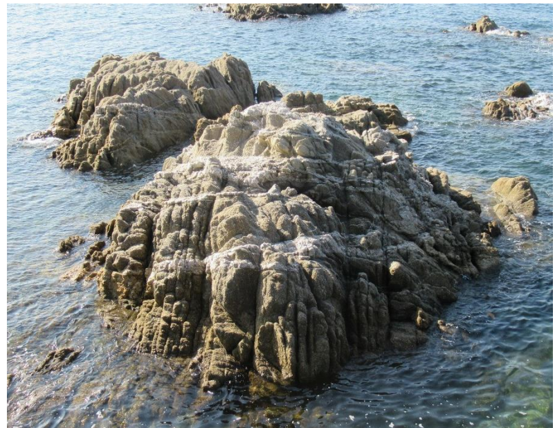
節理の発達状況（花崗岩）