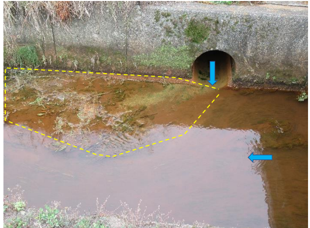
水路からの流入水下流側に土砂が堆積