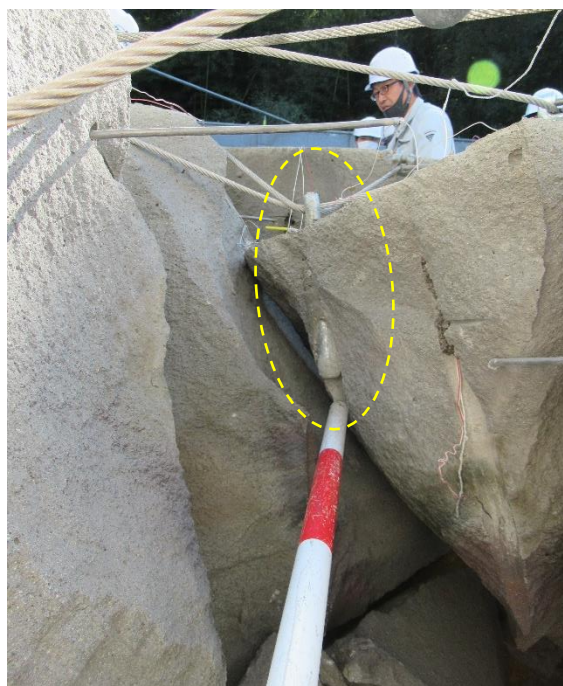
破碎試験時に確認されたアンカーピン（くさび式）の定着状況