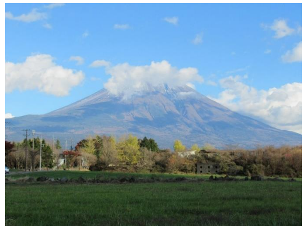
朝霧高原からの富士