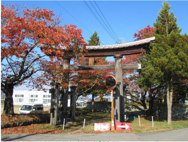
屋根付き木製鳥居