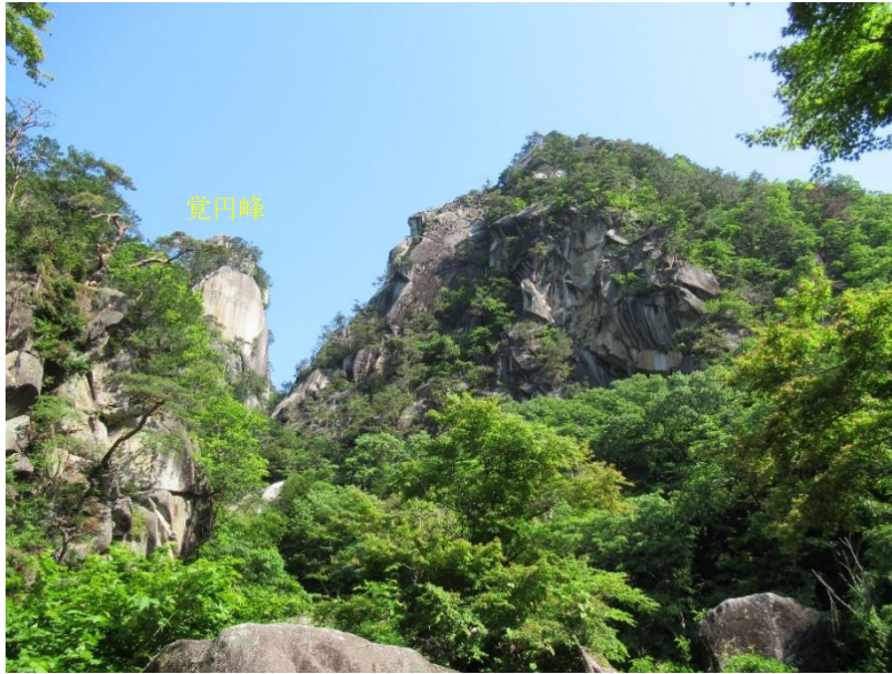
夢の松島より，覚田峰方向

○昇仙峡・・・2021.12月 景勝地“夢の松島”を落石（2～3m角程度）が直撃