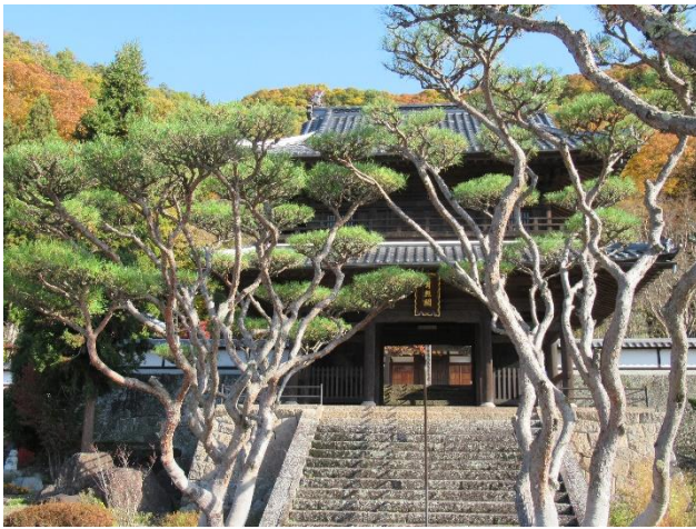
タギョウショウ? (多行松, アカマツの園芸種)