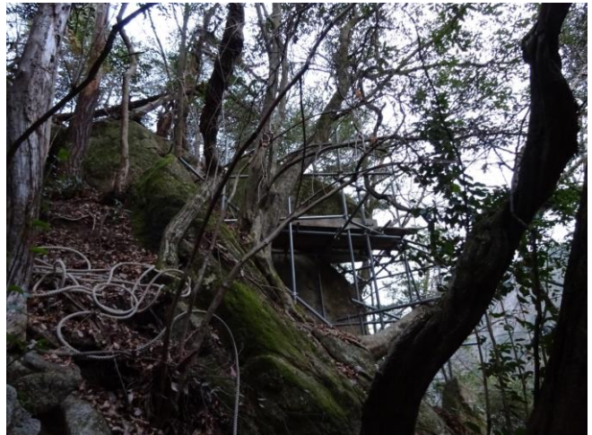
作業の安全や施工性を確保するには足場が必要