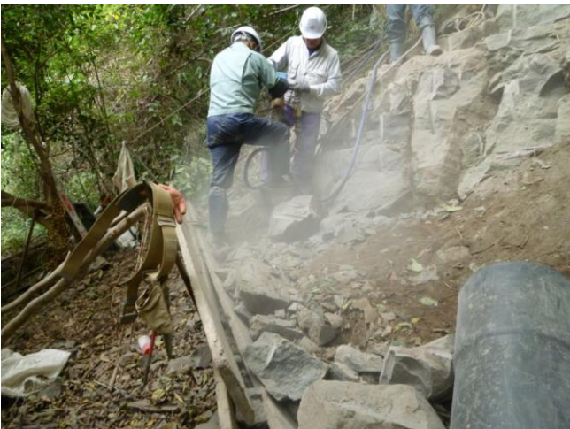
小割り岩塊は地外等へ搬出