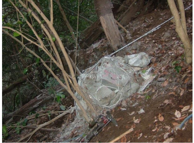
自在性の高いネットで巾着状に包んだ状態で小割りする（立木等によるアンカーで固定した状態）