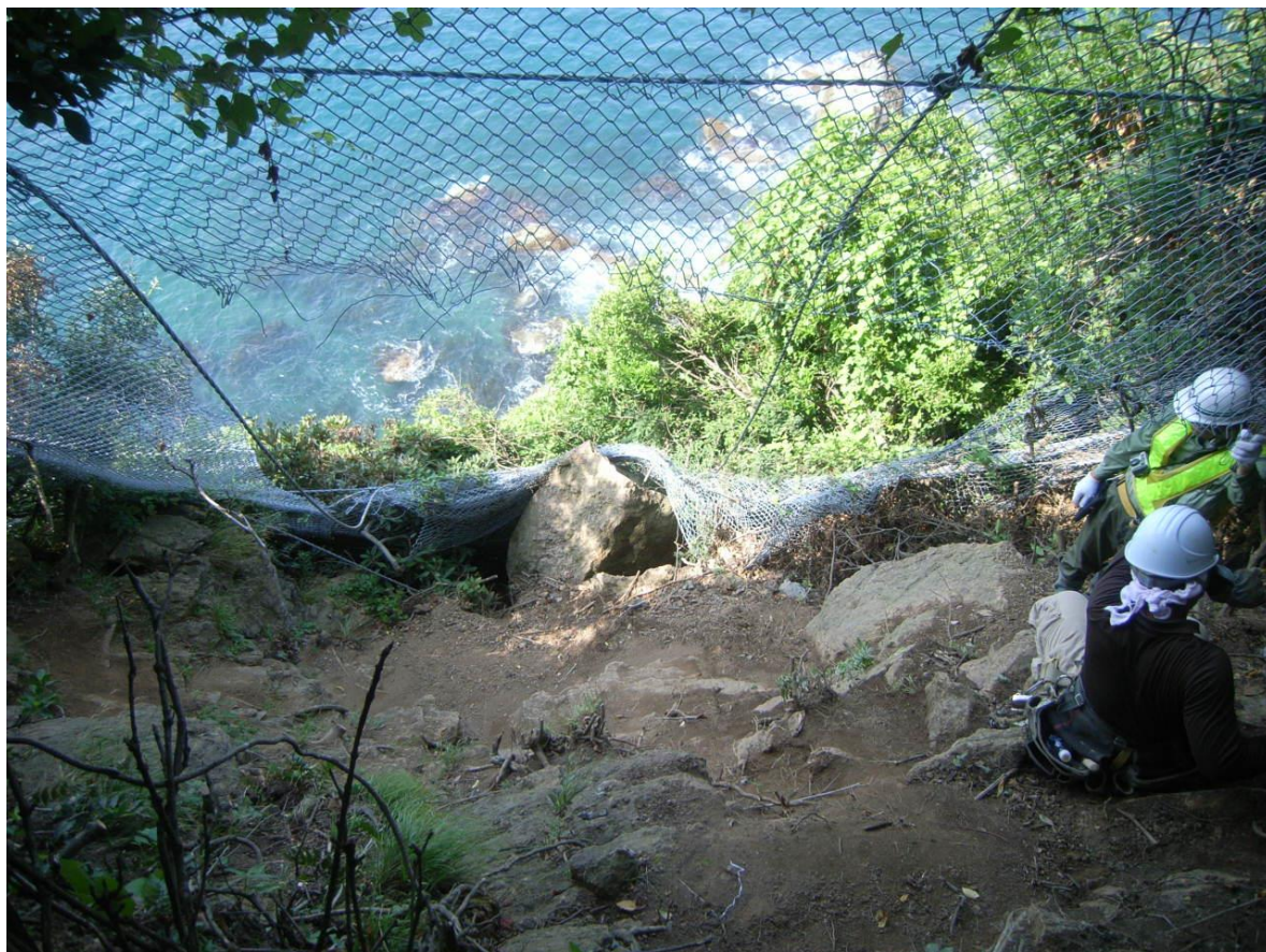
②防護ネットの上下からサンドイッチ状にワイヤーリングで包み、アンカーで固定