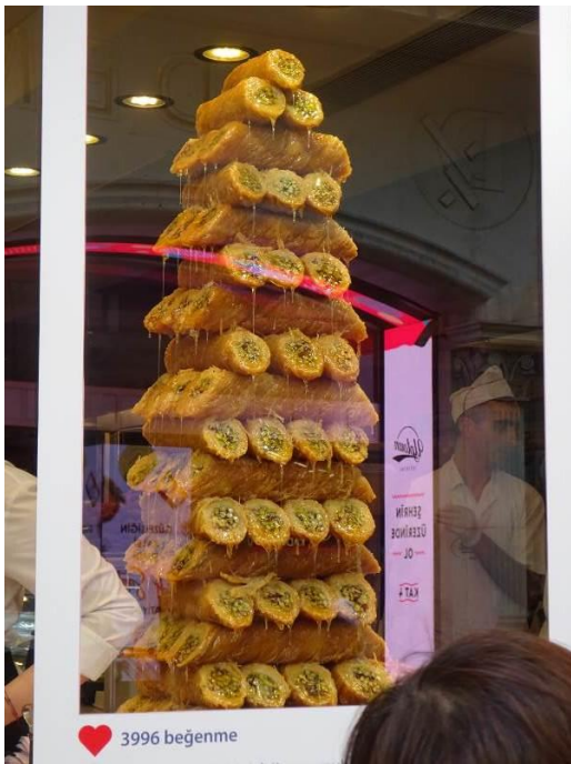
ナッツ等を入れた甘いお菓子