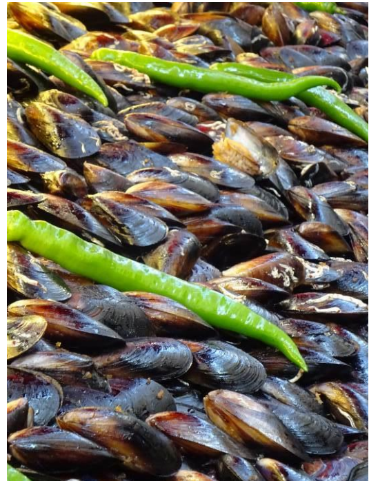
ミディエ・ドルマ