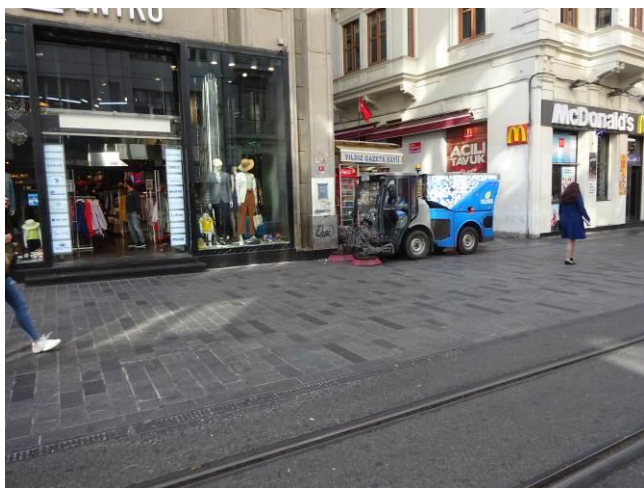
市内を走るごみ清掃車