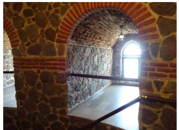
壁は数メートルと厚い