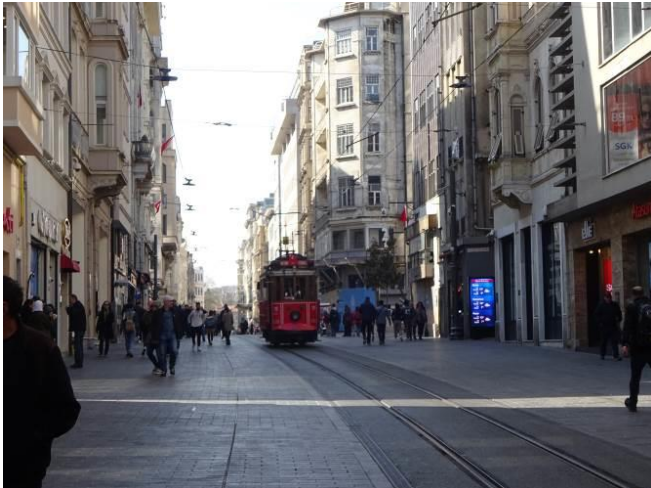
新市街地の中心部（イスティクラール通り）の電車