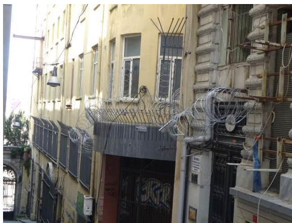
泥棒避けの有刺鉄線