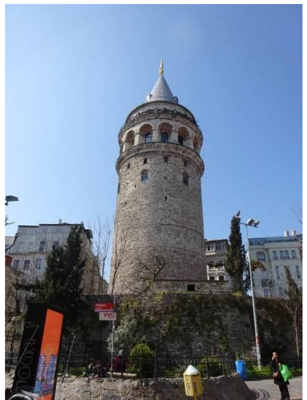
西暦 507 頃建造（木造）。1348 年後に現在の石造りとなる。高さ 66.9m。牢獄、天文台、火の見櫓等として活用。一度は地震で倒壊した模様（納得！）