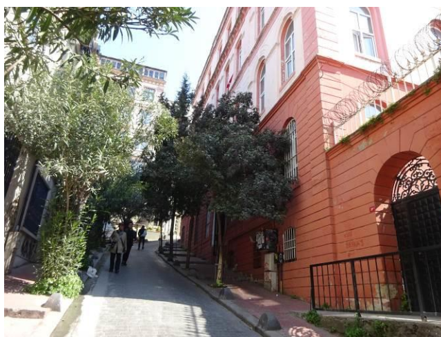
右の建物は小学校（運動場もあるとのことだが・・・）