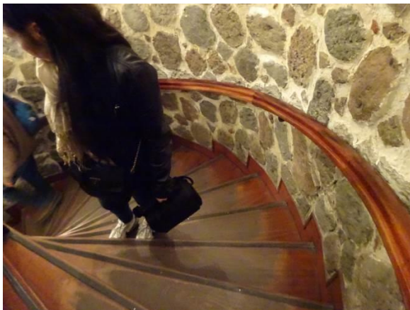
上階は階段のみ（内側ほど勾配が急となる）