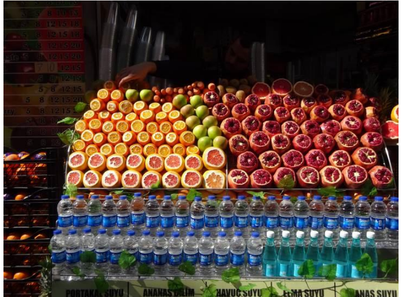
ジュース用（ザクロが好評・・・）

・・・肉の塊（高さ 1m 程度）を回転させながらロースト。焼き上がった表面をそぎ落とし、提供)