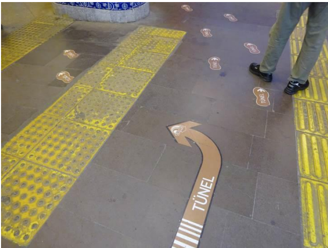
分かりやすい案内表示