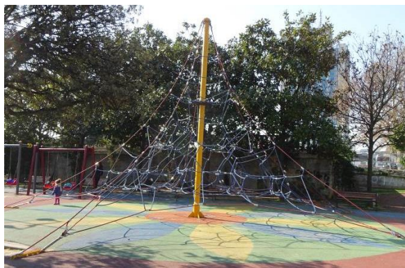
遊具（日本と異なり、ワイヤーロープを使用）