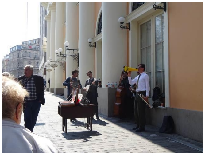
バスキング（路上パフォーマンス）