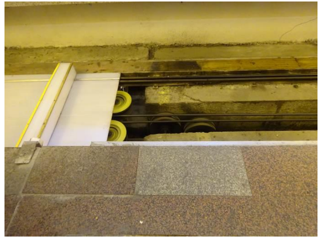
ガラタ塔（丘の上）に行くための、世界で一番短く（乗車時間2分、1区間）、 世界で2番目に古い地下鉄（ケーブルカー）