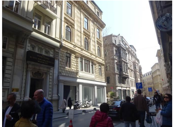
同左，景観保全地区として，建築物等の制限有り